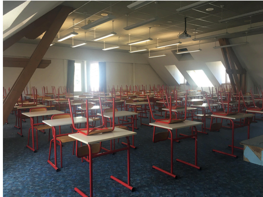
Salles 301 d'examen : 99 places