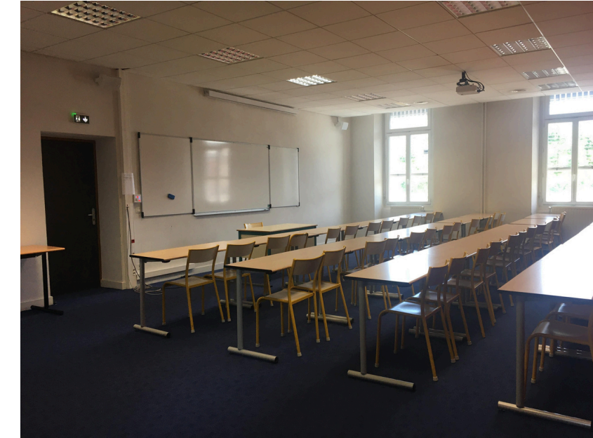
Salles Ceuze : 50 places