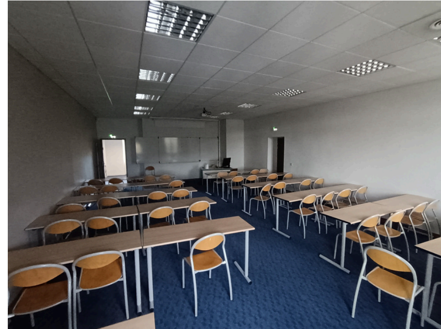
Salles Chaillol : 50 places