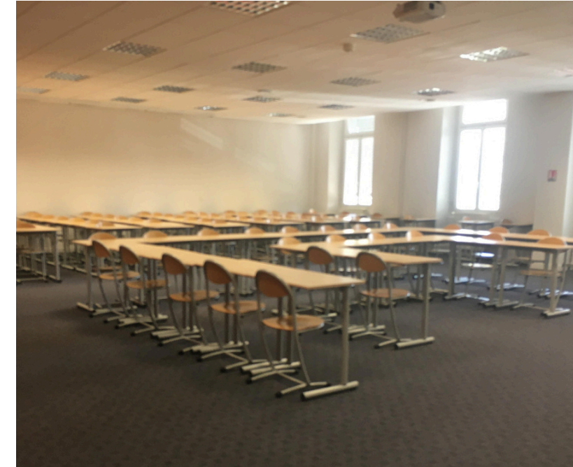
Salles Charrance : 99 places