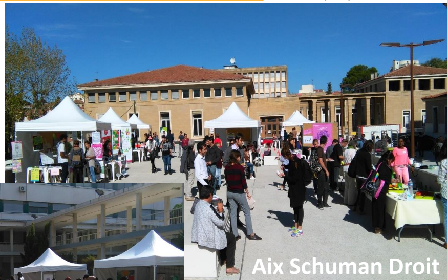
Aix Schuman Droit