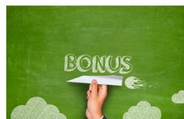
BONUS ENGAGEMENT DD / RS

Activité « Etudiants émissaires (de L2 au M1) » ce bonus cherche à valoriser l'engagement des étudiants d'AMU sur le terrain de l'orientation des lycéens généraux et technologiques de l'Académie d'Aix-Marseille.