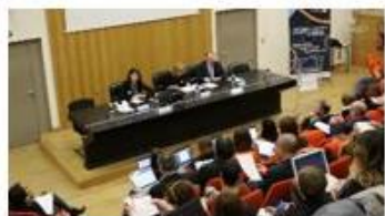
Rencontres « Dire et Faire la Science Autrement »