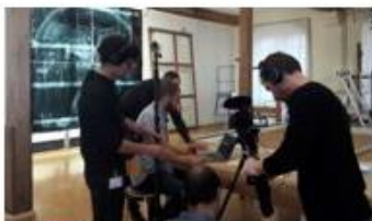
Collection audiovisuelle « Expérimenter l'Avenir »