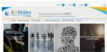
Refonte du site internet d'A*midex

OUTILS de médiation et d'intégration scientifiques