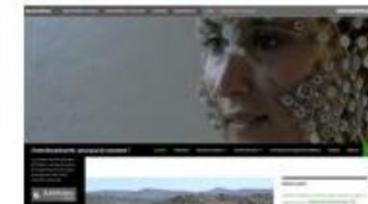
Carnet de recherche