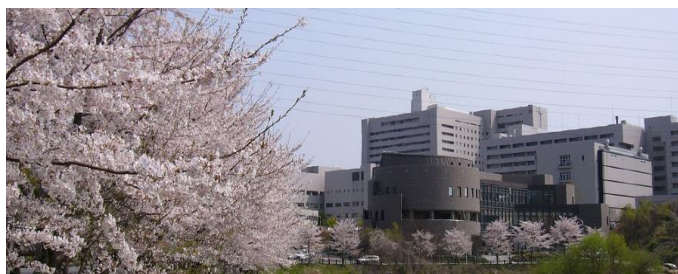
Campus d'Osaka University

L' université d'Osaka (大阪大学, Ōsaka Daigaku ) est une université japonaise située à Suita et à Toyonaka, dans la préfecture d'Osaka dans la région du Kansai. L'établissement compte par ailleurs 14 facultés de cycles supérieurs. Les champs de spécialité de chacune d'elles sont les suivants : Lettres, sciences humaines, droit et sciences politiques, économie, science, médecine, odontologie, pharmacologie, ingénierie, sciences de l'ingénieur, langues et cultures étrangères, géopolitique, sciences et technologies de l'information, bio-sciences. À celle-ci s'ajoute par ailleurs une école de droit.