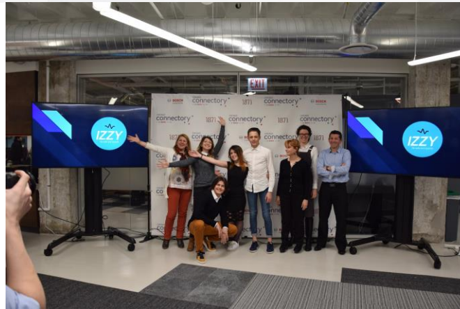
Startup Lycée un dispositif porté par Prépité Paca et tous entrepreneurs : une première en PACA